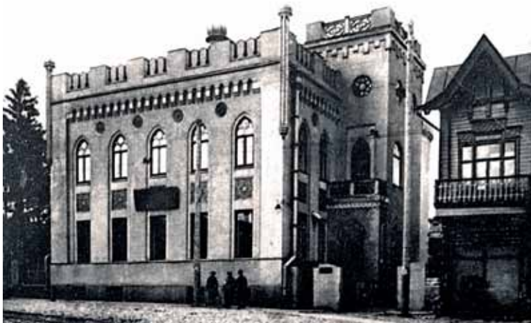
Здание Трахоматозного научно-исследовательского института (ТНИИ) имени проф. Е.В. Адамюка

В 2012 году офтальмологическая общественность Республики Татарстан отмечает сразу две юбилейные даты – 105-летие «Общества офтальмологов Республики Татарстан» и 90-летие Республиканской клинической офтальмологической больницы . Все эти годы деятельность Общества и клиники были неразрывно связаны друг с другом, оказывая взаимное влияние на развитие офтальмологии в регионе.